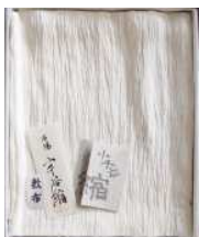
①小千谷縮 敷布 麻 150x250 ¥50,000+ 税

現在でも小千谷縮は、湯もみという作業が欠かせません。強撚の糸で織った麻織物を、40度前後のお湯の中で手揉みにより、丹念に生地をほぐしながら、シボをだします。この風合いにより日本の誇る、織物文化の象徴といえる小千谷縮が誕生します。