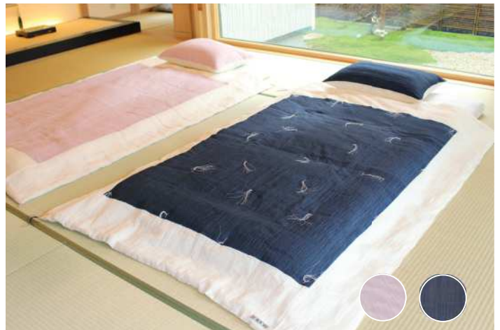
◆縮 掛布団綴込 額縁 薄紅藤 / 鉄紺 側地：麻 中綿：麻 140x190 各¥75,000+ 税