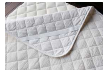
◆白縮 ベッドパッド 表地：麻 裏地：綿 中綿：麻 100x205 ¥35,000+ 税

縮のひんやりとした肌触りが気持ち良いファスナー式の枕カバーです。洗濯機での丸洗いが可能で清潔にお使いいただけます。