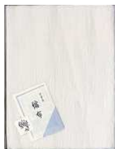
②縮布フラットシート 麻 145x250 ¥24,000+ 税