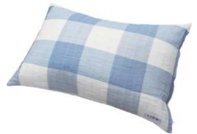
◆小千谷縮ピロケース ファスナー式 麻 43x63 各¥10,000+ 税

小千谷縮の着尺を贅沢に使用しました。 裏面は白縮を使用。 両面お使いいただけます。