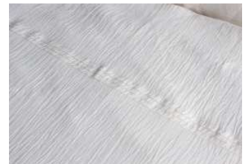
◆白縮 掛布団カバー 麻 140x190 ¥63,000+ 税

表面に無地の白縮、裏面に今治産のタオル生地を縫い合わせました。両面お使いいただける仕様です。お好みで異なる肌触りを体感できます。