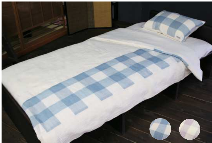
◆小千谷縮 掛布団カバー 格子 ファスナー式 麻 140x190 各¥75,000+ 税

ひんやり爽やか、さらっとした触感、上質な雰囲気がいっぱいに広がります。小千谷縮は江戸城御用縮に任せられ、各藩各大名の間でも寝装寝具に使われていました。放熱性・放湿性に優れ、洗濯も容易で日常使いが出来ます。エアコンをつけなくても、寝返りを打つ度にひんやり感が伝わってきます。