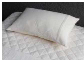
◆白縮 枕カバー 麻 43x63 ¥9,000+ 税

見た目も涼やかな白縮の掛布団カバーは吸湿性、発散性に優れ、ひんやりとした触感が特徴です。首元の3本のピンタックがシンプルでさり気なく上品なデザインです。