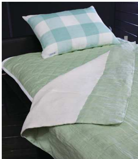
◆縮ベッドパッド 浅緑・薄紅藤 表地：麻 裏地：綿 中綿：麻 100x205 各¥35,000+ 税

表面に無地の白縮、裏面に今治産のタオル生地を縫い 合わせました。両面お使いいただける仕様です。 お好みで異なる肌触りを体感できます。