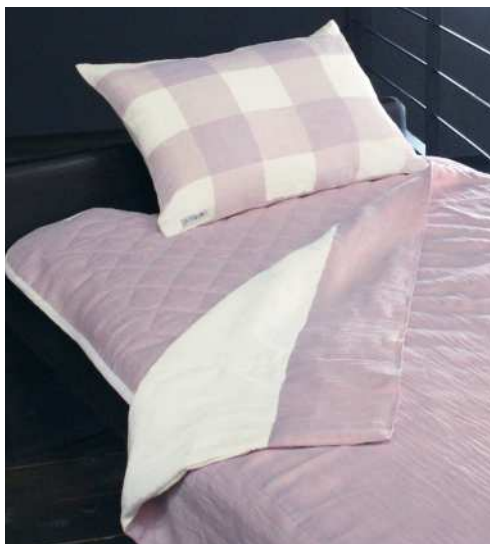
◆縮タオルケット 薄紅藤・浅緑 表地：麻 裏地：綿 140x190 各¥35,000+ 税

表面に無地の白縮、裏面に今治産のタオル生地を縫い 合わせました。両面お使いいただける仕様です。 お好みで異なる肌触りを体感できます。