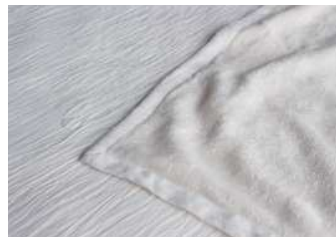
◆白縮 タオルケット 表地：麻 裏地：綿 140x190 ¥35,000+ 税

表面に無地の白縮、裏面に今治産のタオル生地を縫い合わせました。両面お使いいただける仕様です。お好みで異なる肌触りを体感できます。